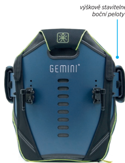
GEMINI TWIN L + boční peloty*