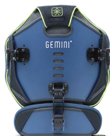
GEMINI TWIN M + bederní opěrka