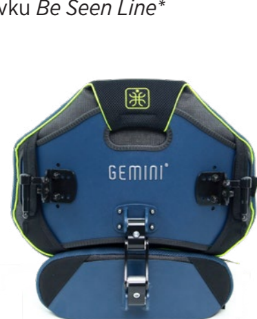
GEMINI TWIN S + bederní opěrka